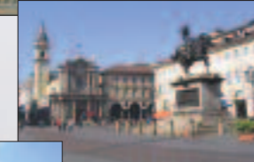
Piazza San Carlo