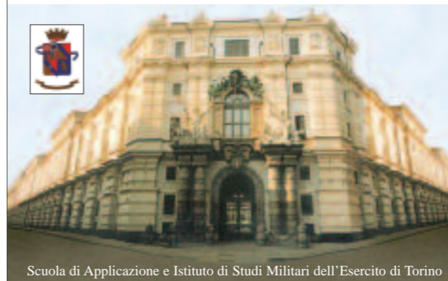
Scuola di Applicazione e Istituto di Studi Militari dell'Esercito di Torino