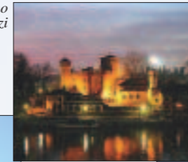
Castello del Valentino Murazzi

Viale dei Mille, 140 - 43100 Parma Tel. 0521/290191-FAX 0521/291314 e-mail: siop@mvcongressi.it (Roberto Olivieri) www.mvcongressi.it