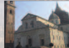
Sacra Sindone Duomo