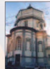
Monte dei Cappuccini