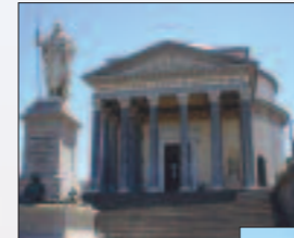
Chiesa Gran Madre di Dio